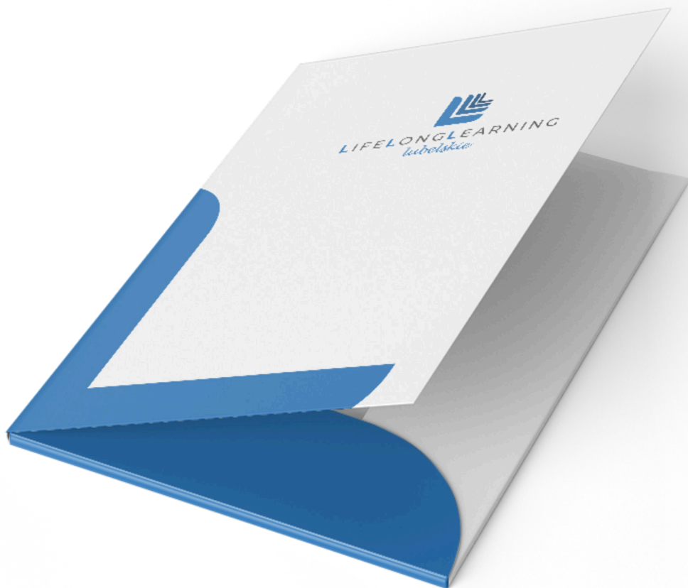
Teczka na dokumenty