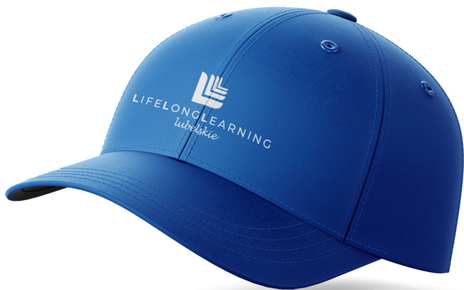
Czapka z daszkiem