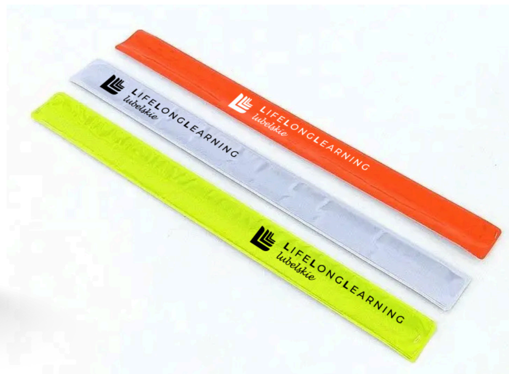
Linijka / Opaska odblaskowa